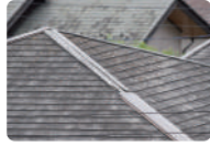
屋根・棟の板金外れ