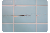
浴室タイルのヒビ