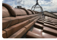
瓦のスレ・漆喰損失