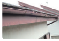
雪害による雨樋の損傷