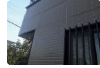
外壁サイディングのスレ